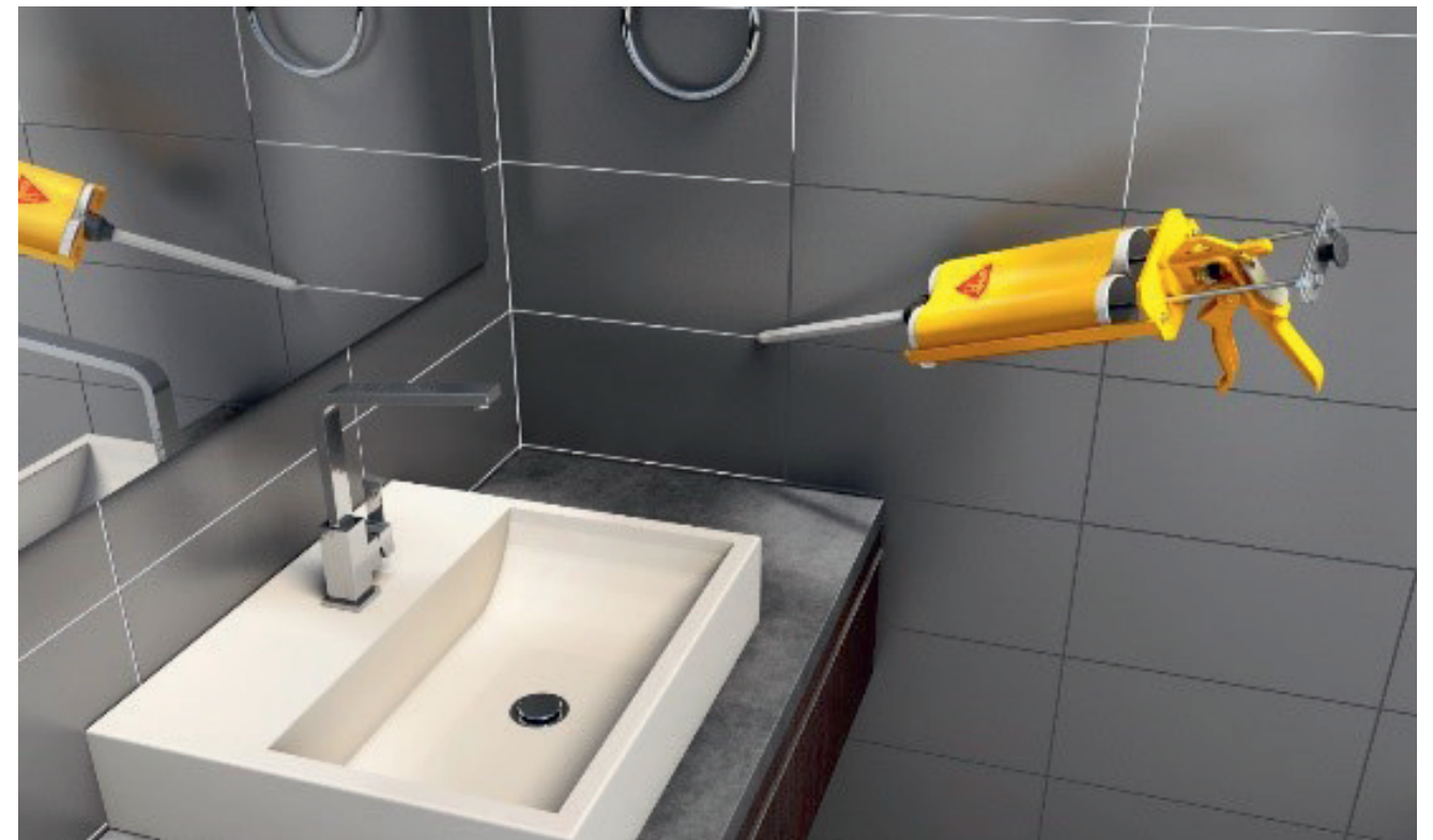
新型环氧瓷砖美缝剂使用方便，装饰效果出色