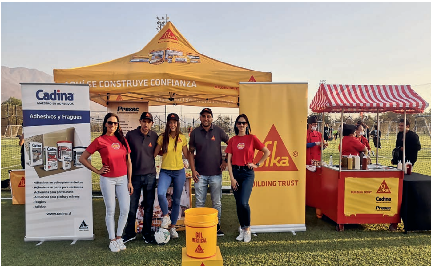
赞助由Easy组织的当地足球锦标赛，Easy是一家DIY分销商，他们的承包商和终端用户都参加了比赛。