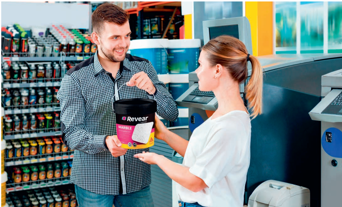
Reveal是阿根廷涂料市场的一个知名品牌，专注于纹理装修领域

收购派丽后，西卡旗下多出了38个品牌，他们的内部合并活动已经启动。未来五年内，大多数派丽品牌和产品都将合并到西卡的产品系列中。下一步是做好规划，并确保产品平稳“上架”。