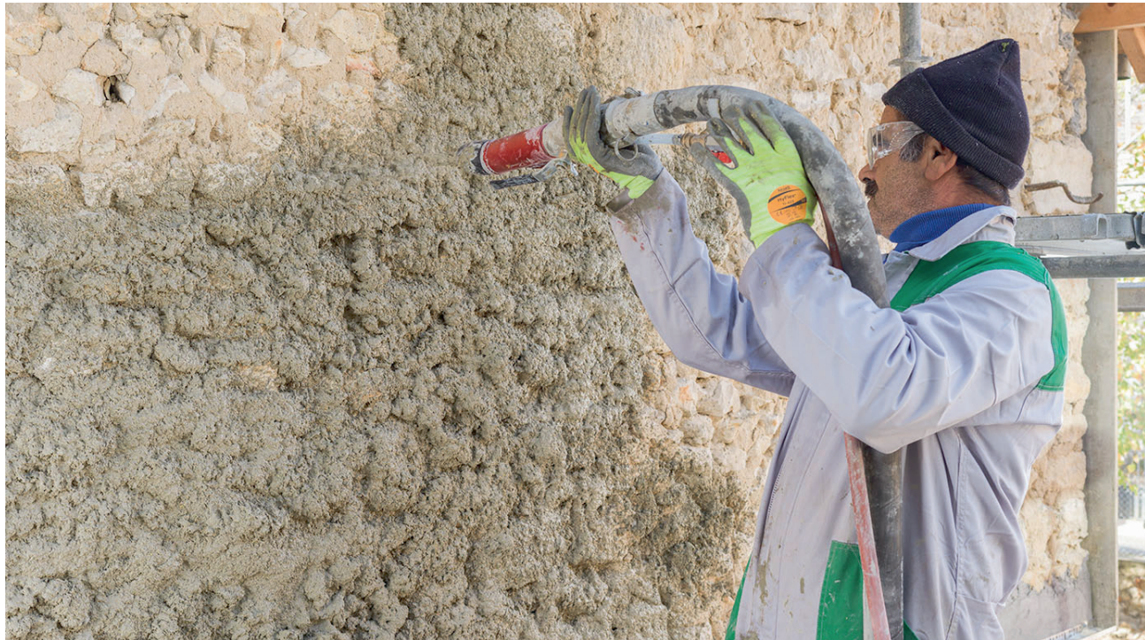
PARNATUR®, 首款“易喷涂”隔热隔音麻基砂浆