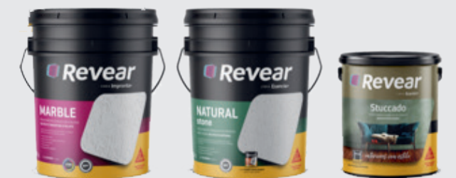
Reveal是阿根廷涂料市场的一个知名品牌，专注于纹理专修领域

在阿根廷，Reveal主要在涂料经销商的店内销售，目标人群是西卡的一类新型终端用户：业主。这一细分市场的客户认为西卡是一个技术型品牌，而Reveal的品牌形象则更具感性。Reveal和西卡强强联合后，这两个品牌将分别从彼此的优势和核心品牌资产中获益。