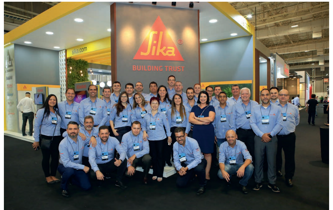
阿根廷和巴西的西卡和派丽团队合作参加了巴西举办的建筑师和承建商贸易展览会Revestir Expo

客户能够通过一站式服务获得更广泛的建筑解决方案，他们对此感到兴奋不已。两家公司都收获了跨产品系列的客户订单，而他们也将其视为扩展业务的难得契机。