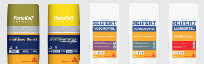
将Portokoll（巴西）和Seifert（比利时）合并到西卡的第一个过渡阶段的包装示例。

Seifert在比利时本土市场的外墙业务中占有很高的市场份额，而西卡目前还尚未进入这个市场。两个品牌都能从中受益：西卡可以接触到新客户，而Seifert则可借助西卡的销售网络分销他们的产品。Seifert之前从未通过分销出售过产品。