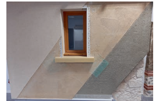
PARNATUR®旨在减少建筑水泥的使用、减少CO 2 排放