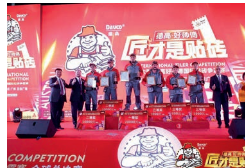
2019年11月，国际贴砖大赛在中国广州举办