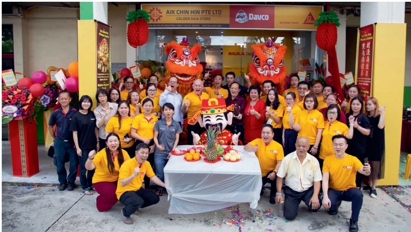
2020年2月金牌门店正式开业