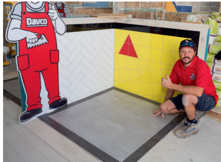
2019年9月，贴砖大赛在澳大利亚悉尼举办

西卡非常重视贴砖技师，并致力于提升他们的技术水平和专业知识，西卡深知项目的成功既需要优质的产品，也离不开技艺高超的匠人。西卡的分销网络遍布全球100个国家和地区，而派丽每年会在全球范围内培训近10万名贴砖技师，具备丰富的行业经验和专业知识，双方的共同努力必将使贴砖技师的技术更上一层楼。