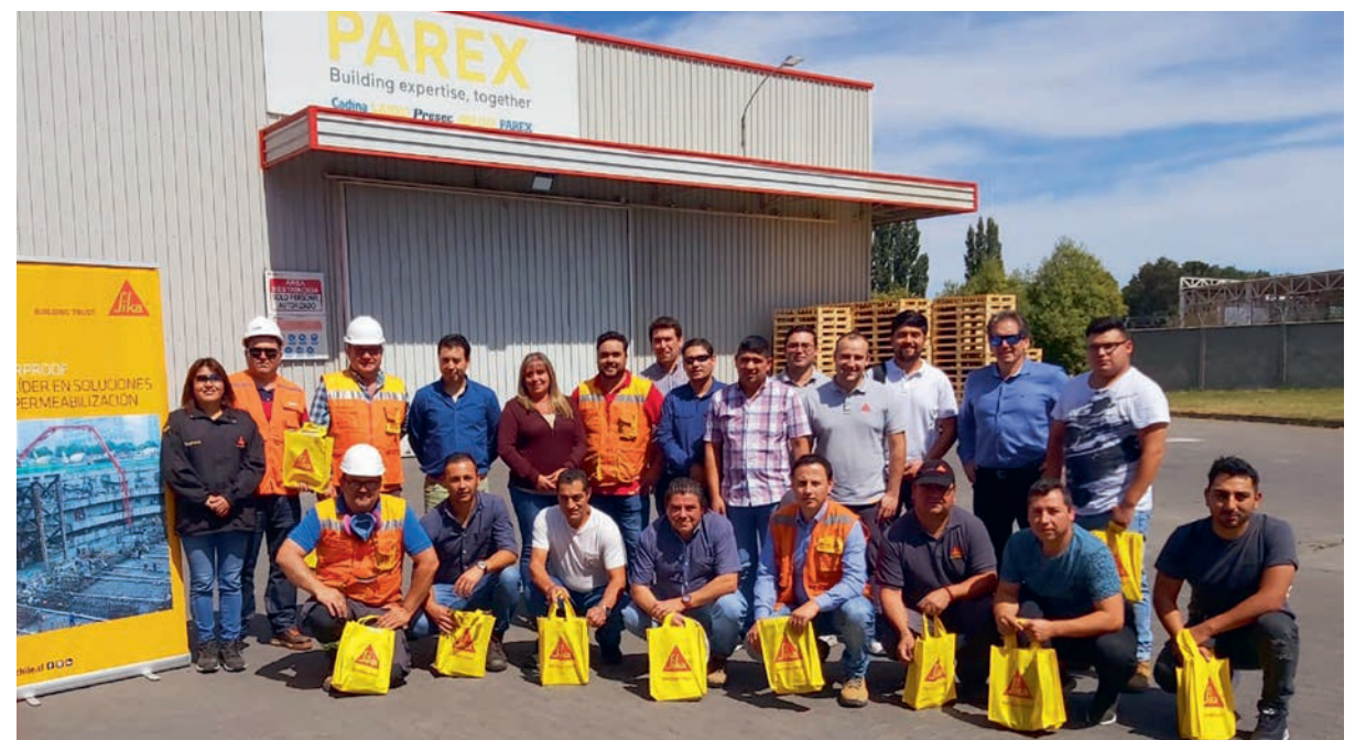
在派丽工厂开展的西卡客户培训活动

最后，我们的下一步计划是成为一家公司——西卡，新公司将得益于西卡和派丽积累的宝贵经验。