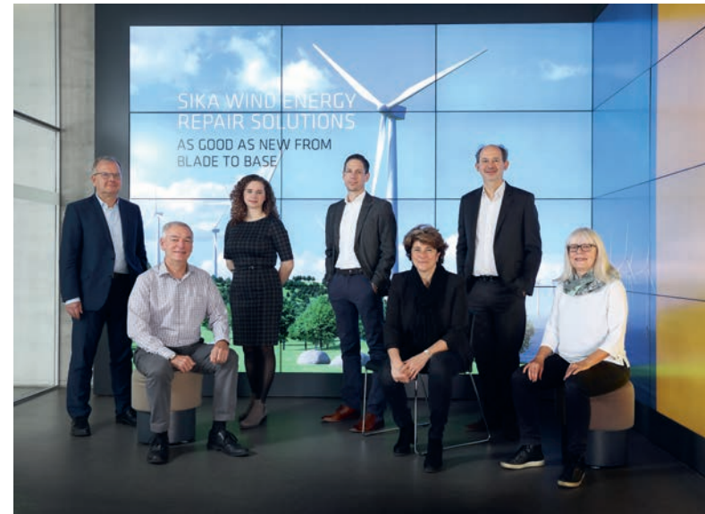
收购的派丽公司的可持续发展专家们已完全融入西卡可持续发展团队之中。

在选定的国家设立派丽计划，并与法国社会企业“PUR Projet”以及社区农林业、再造林和保护项目方面的专家携手合作推进这一计划。这一计划旨在减轻气候变化影响、节约用水以及支持当地社区发展。