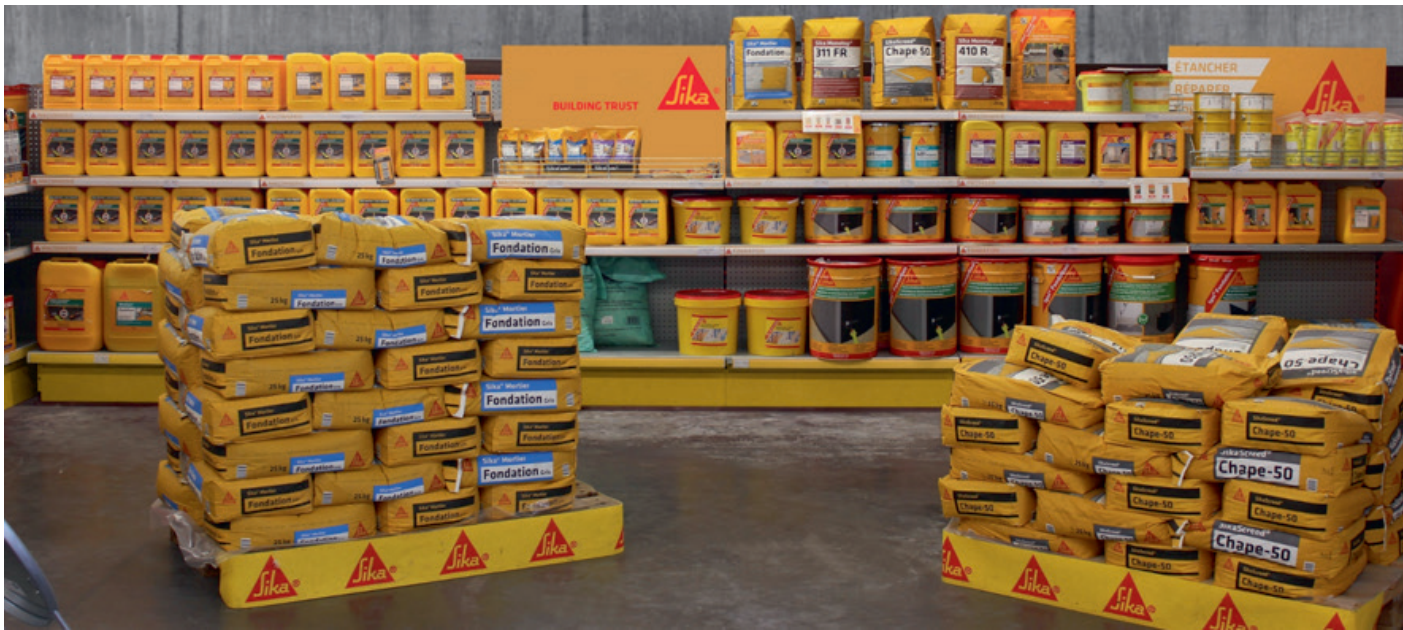
在法国分销商处展示西卡货架